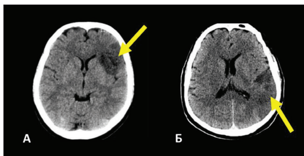
Слика 2. Фокалне исхемијске лезије мозга (стрелице) у Брокиној зони за експресивни говор (А) и Верникевој зони за рецептивни говор (Б) које доводе до губитка процесне способности услед немогућности адекватне комуникације