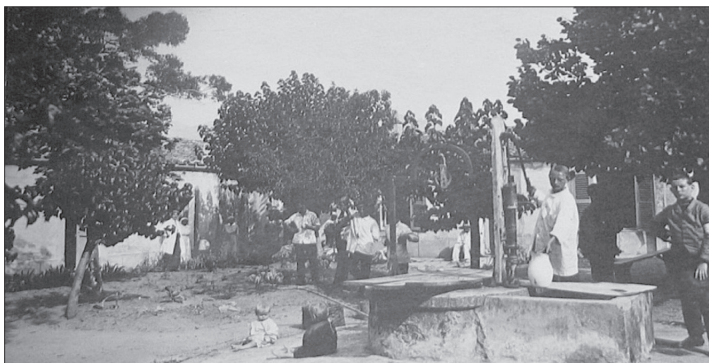
Слика 2. Болница шкотских жена за Србе у Ајачу, на Корзици Figure 2. The Scottish Women's Hospital in Ajaccio, on Corsica