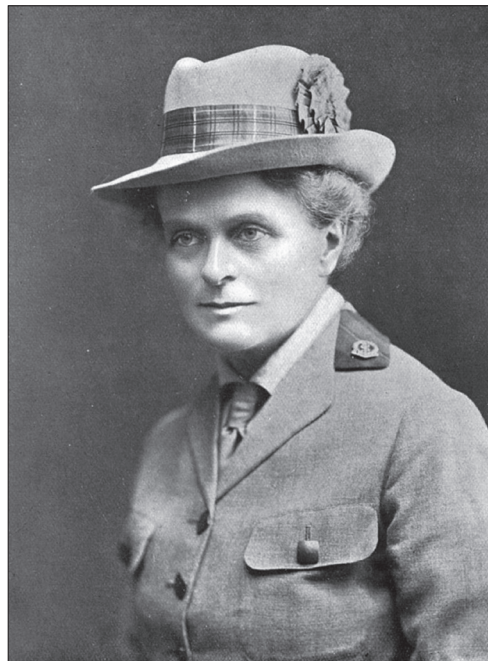
Слика 1. Др Елси Мод Инглис (1864–1917) Figure 1. Dr. Elsie Maud Inglis (1864–1917)

Др Елси Инглис, оснивач и „покретачки дух“ чланица Болница шкотских жена широм Европе, била је прва жена носилац високог српског одликовања – Ордена белог орла. Меморијална чесма на Црквенцу, у Младеновцу, најлепши је споменик посвећен др Елси Инглис и чланицама Болница шкотских жена који је српски народ подигао у време рата, као дар захвалности за њихову племенитост и пожртвовање. У знак сећања и поштовања на др Инглис, Болница шкотских жена је формирала Јединицу „Др Елси Инглис“ као појачање болницама на