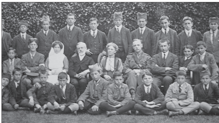
Слика 9. Српски ученици у Француској Figure 9. Serbian schoolboys in France

и болесни војници су добили поклоне од становника Бастије, а после заједничке закуске приређен је концерт. Пригодна свечаност је окупила велики број српских избеглица, чланице Болнице шкотских жена, Српског потпорног фонда, локално становништво Бастије, српско свештвенство, наставнике и ученике из Лицеја. Посебно је био запажен хор српских ђака, који је певао патриотске и народне песме из старог краја, о чему су писали и бастијски листови. У Српској цркви у Бастији припадници српске избегле колоније приредили су и свечаности за Видовдан и Петровдан 1918. са свечаним литургијама и благодарењима у част рођендана Њ. В. краља Петра I [6] (слике 8 и 9).