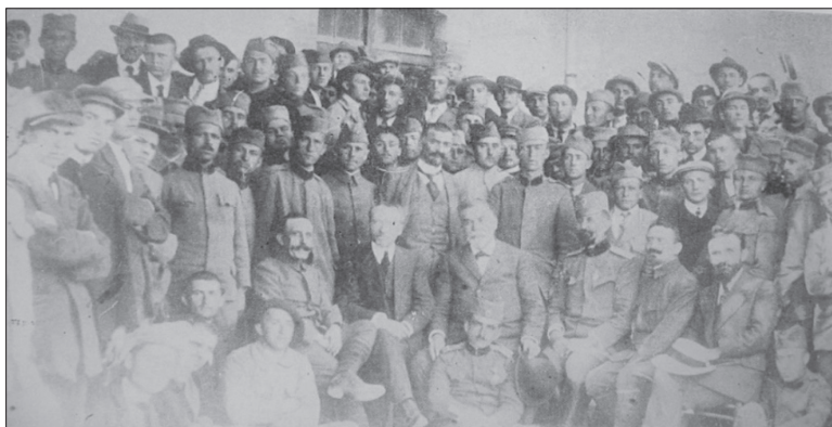
Слика 8. Српски ученици и студенти у Француској Figure 8. Serbian schoolboys and students in France

У Болници шкотских жена је приређена велика свечаност поводом Божића, на дан 25. децембра 1918. Рањени