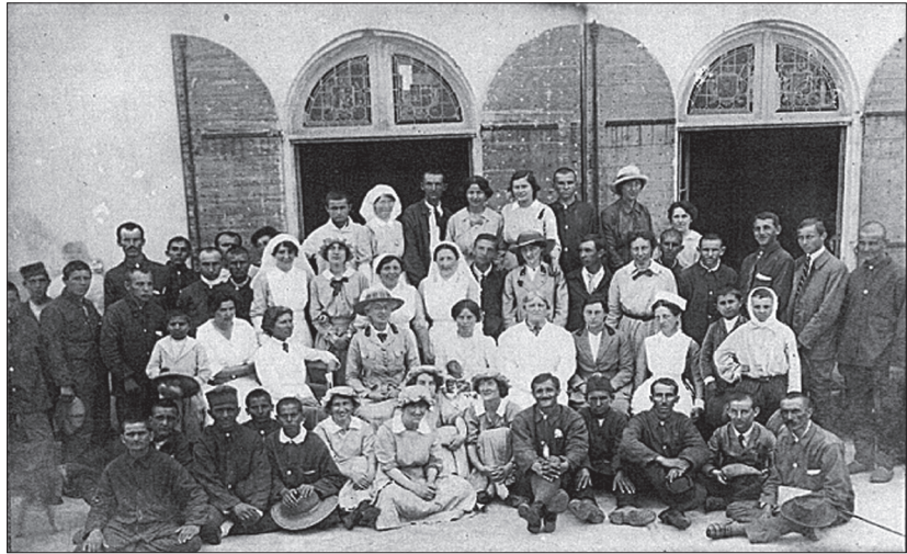
Слика 3. Болнице шкотских жена, Јединица „Корзика“, Ајачо, Корзика Figure 3. The Scottish Women's Hospitals, Corsica Unit, Ajaccio, Corsica

Јединица „Гиртон и Њунам“ у Солуну била је у саставу француског санитета, са наменом појачања српског војног санитета на Солунском фронту. Само у периоду јул–август 1916. болница је примила 1000 пацијената, а најчешће са дијагнозом маларије и дизентерије. Након Горничевске и Кајмакчаланске битке, велику улогу у хируршком збрињавању имале су јединице Болница шкотских жена у Солуну и Острову. Је-