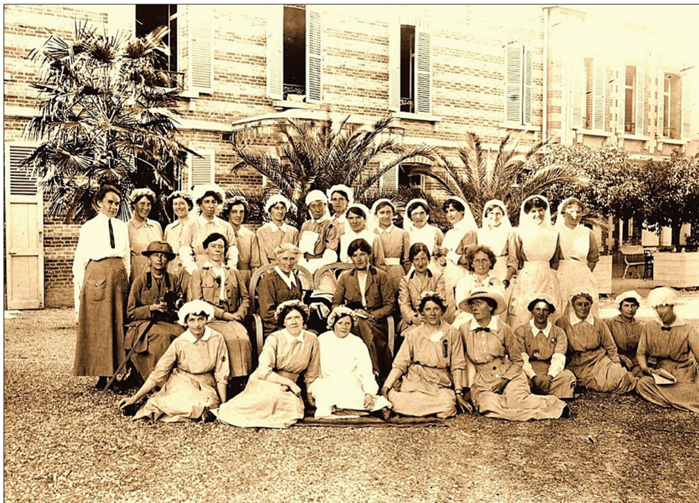
Слика 1. Болнице шкотских жена, Јединица „Гиртон и Њунам“ на Солунском фронту Figure 1. Scottish Women's Hospitals, Girton and Newnham Unit, the Salonika Front