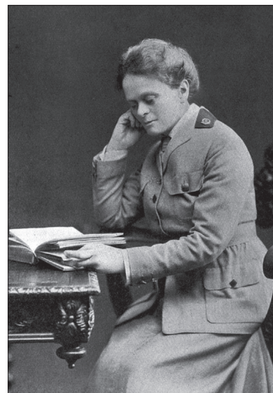
Слика 8. Др Елси Мод Инглис (1864–1917) године 1916.

Figure 7. Dr. Isabel Emslie, CMO of the Scottish Women's Hospitals in Vranje