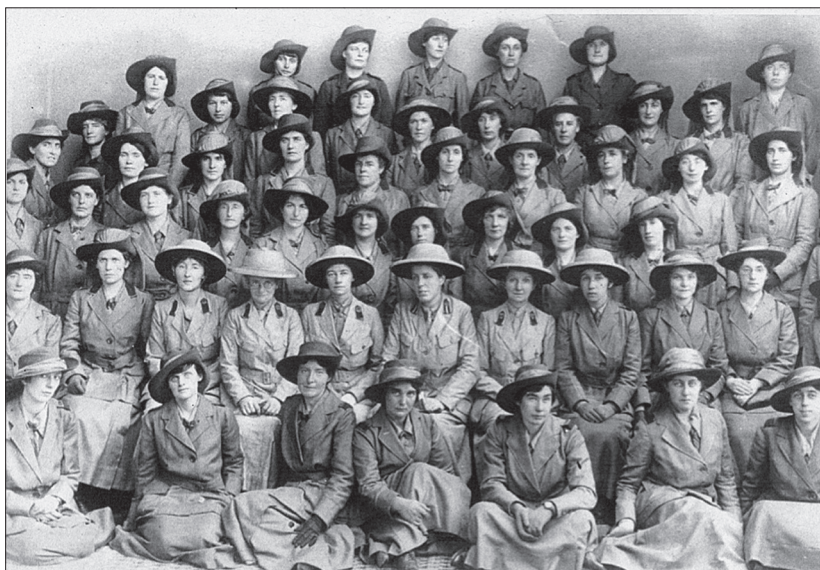
Слика 4. Болнице шкотских жена, Јединица „Америка“, у Острову, на Солунском фронту Figure 4. The Scottish Women's Hospitals, America Unit, Ostrovo, Salonika Front