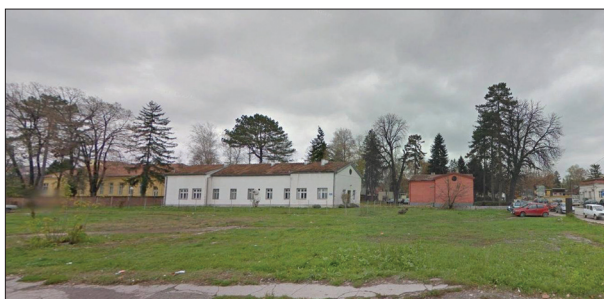
Слика 4. Фотографије данашњег стања некадашњих зграда администрације и јужног павиљона ваљевске Окружне болнице из 1884. године; у позадини са леве стране, иза зидане оградe, двориште Архива са архивским депоом, некадашњим хируршким павиљоном

Figure 3. A current photograph of Valjevo from above; a segment with the facilities of the former hospital complex; to the right: two hospital buildings from 1884; in the northeast corner: a new military clinic with the infirmary; to the west, behind the fence: Archive complex with its depot, a former surgical pavilion from 1906