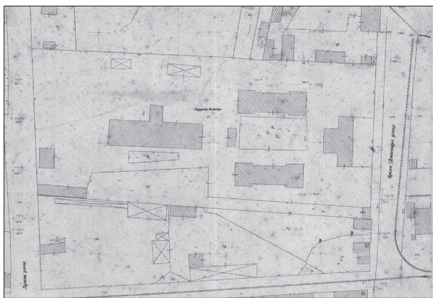
Слика 2. Комплекс ваљевске Окружне болнице на сегменту катастарског плана Ваљева из 1926. године [25]

Figure 1. The garden of Valjevo District Hospital in 1915: parts of the administrative building and one pavilion, dating to 1884 [23]