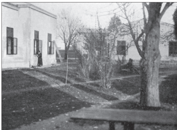
Слика 1. Фотографија врта ваљевске Окружне болнице 1915. године; виде се делови административне зграде и једног од павиљона из 1884. године [23].

Figure 1. The garden of Valjevo District Hospital in 1915: parts of the administrative building and one pavilion, dating to 1884 [23]