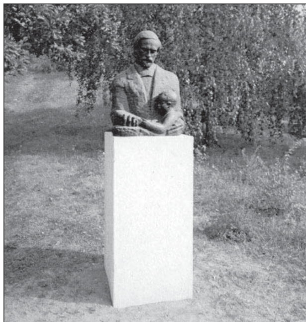
СЛИКА 2. Споменик испред спомен-куће др Јована Јовановића Змаја у Сремској Каменици.

FIGURE 2. The sculpture in front of the memorial house of Dr. Jovan Jovanović Zmaj in Sremska Kamenica.