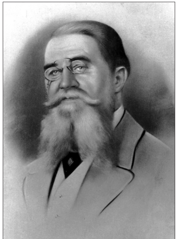
СЛИКА 1. Милан Јовановић Батут, оснивач и члан Универзитетског оснивачког одбора за Медицински факултет.

Без сумње, медицински факултет био је потребан „не само науци уопште и медицинској струци посебно, већ и лекарима за њихово усавршавање после завршених студија“ [3] и део је јавног живота једне земље и њене историје. С друге стране, не смео сметнути с ума да су сва та спорења у суштини само продубљивала проблеме ондашње здравствене службе и здравствене заштите и успорила оснивање првог