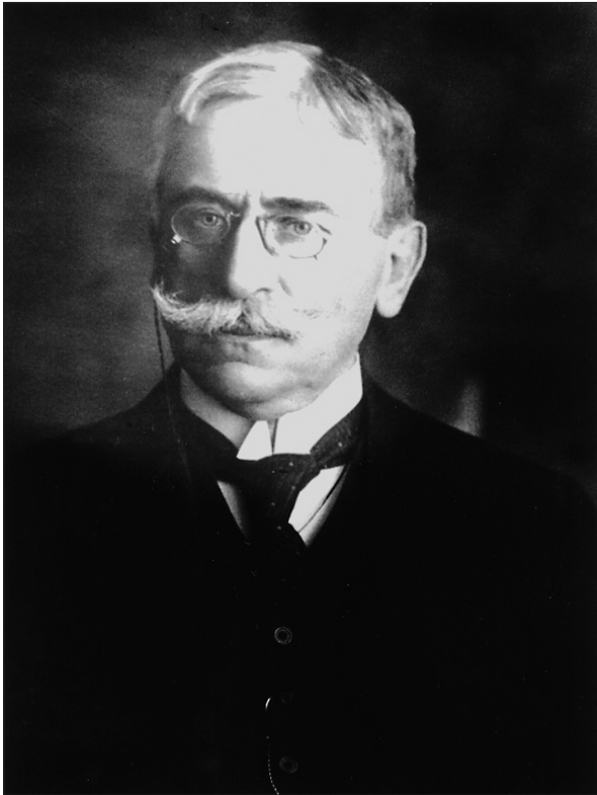
СЛИКА 3. Војислав Субботић, шеф Хирушког одељења Опште државне болнице, оснивач и први професор хирургије Медицинског факултета.

FIGURE 3. Vojislav Subbotić, a Head of Surgical Department of General State hospital, a founder and first professor of surgery at the School of Medicine.