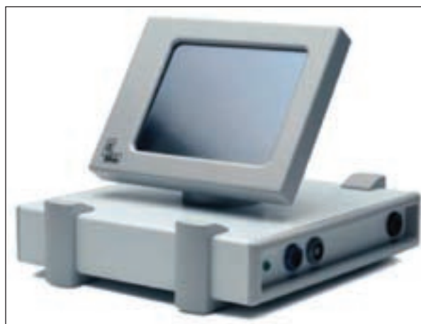
СЛИКА 1. Компјутерски пантограф „аркус дигма“. FIGURE 1. The computer pantograph Arcus-Digma.

Пошто је образни лук постављен на лице и након тога што су извршене неопходне припреме за употребу „аркус дигма“ јединице, испитаник треба да доведе мандибулу у интеркуспални положај и да снажно загризе. У овом положају електронски пантограф аутоматски региструје позицију горње и доње вилице и положај кондила у левом и десном зглобу – такозване кинематске центре ротације. Ова позиција кондила читава се на монитору „аркус дигме“ као по-