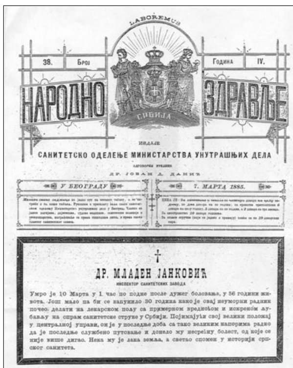
СЛИКА 2. Некролог из „Народног здравља“ FIGURE 2. Obituary in “Narodno zdravlje”

ји. Ипак, пронашли смо децидирана мишљења о томе да је у читавај држави био уважена личност [11, 19]. Био је успешан у пословима које је обављао и на функцијама које је часно вршио, а углед је стекао неуморним радом и вишеструким способностима, али и маркантном фигуром, отменим држањем и лепим понашањем. Живот и дело његове личности нераскидиво су везани за процес стварања здравствене културе народа у Србији [20].