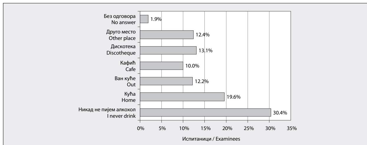
ГРАФИКОН 1. Расподела испитаника према месту где су последњи пут пили алкохолно пиће.

GRAPH 1. Distribution of the examinees according to the place where they used alcohol.