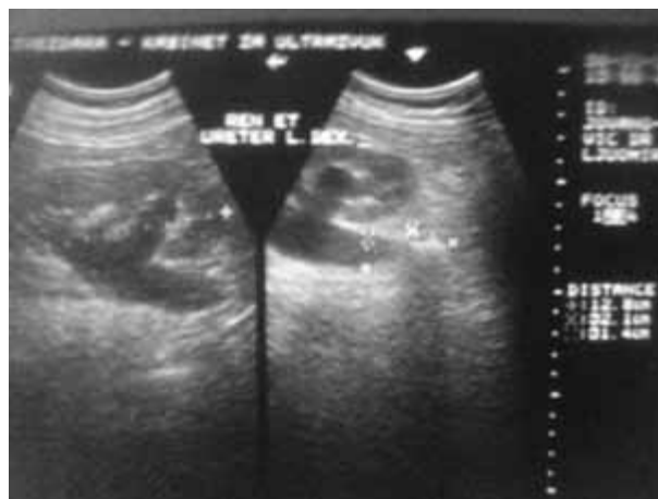
Слика 1. Ехосонограм уротракта: стаза десног бубрега изазвана инклавираним и крупним каменом (пречника 21 mm ) лумбалног уретера

Ефикасност дезинтеграције камена је процењивана на основу налаза контролног рендгенског нативног снимка и ултразвучног прегледа уротракта након 10-14 дана и три месеца након литотрипсије, а код болесника друге групе непосредно након интервенције или следећег дана, те након три месеца. По потреби су вршени и ванредни контролни прегледи. Успех је дефинисан одсуством делова камена на контролном радиограму уротракта до три месеца након литотрипсије.