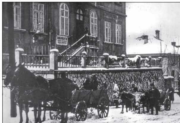
Слика 6. Превоз малих болесника у Дечју болницу у Вишеградској улици у зиму 1922. године

Figure 5. The building in 20 Višegradska Street, Belgrade, where the Anglo-Serbian Children’s Hospital was accommodated 1921-1934