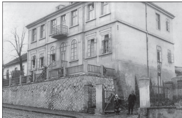
Слика 5. Зграда у Вишеградској улици број 20 у Београду, где је била смештена „Енглеско-српска дечја болница” 1921-1934. године